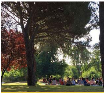
CAMPAMONTES -EL PARDO-