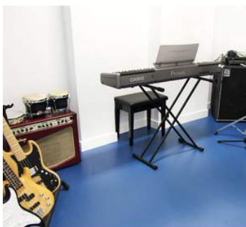
ESCUELA DE ROCK MADRID

En el Club Deportivo Somontes situado en el Monte de “El Pardo” al noroeste de Madrid. Un entorno natural privilegiado y de alto valor ecológico. Disponemos de pistas de tenis, pádel, pistas deportivas cubiertas, sala de psicomotricidad, piscinas olímpicas y para lo más pequeños, parque infantil, Un campamento urbano en Madrid fuera de lo común.